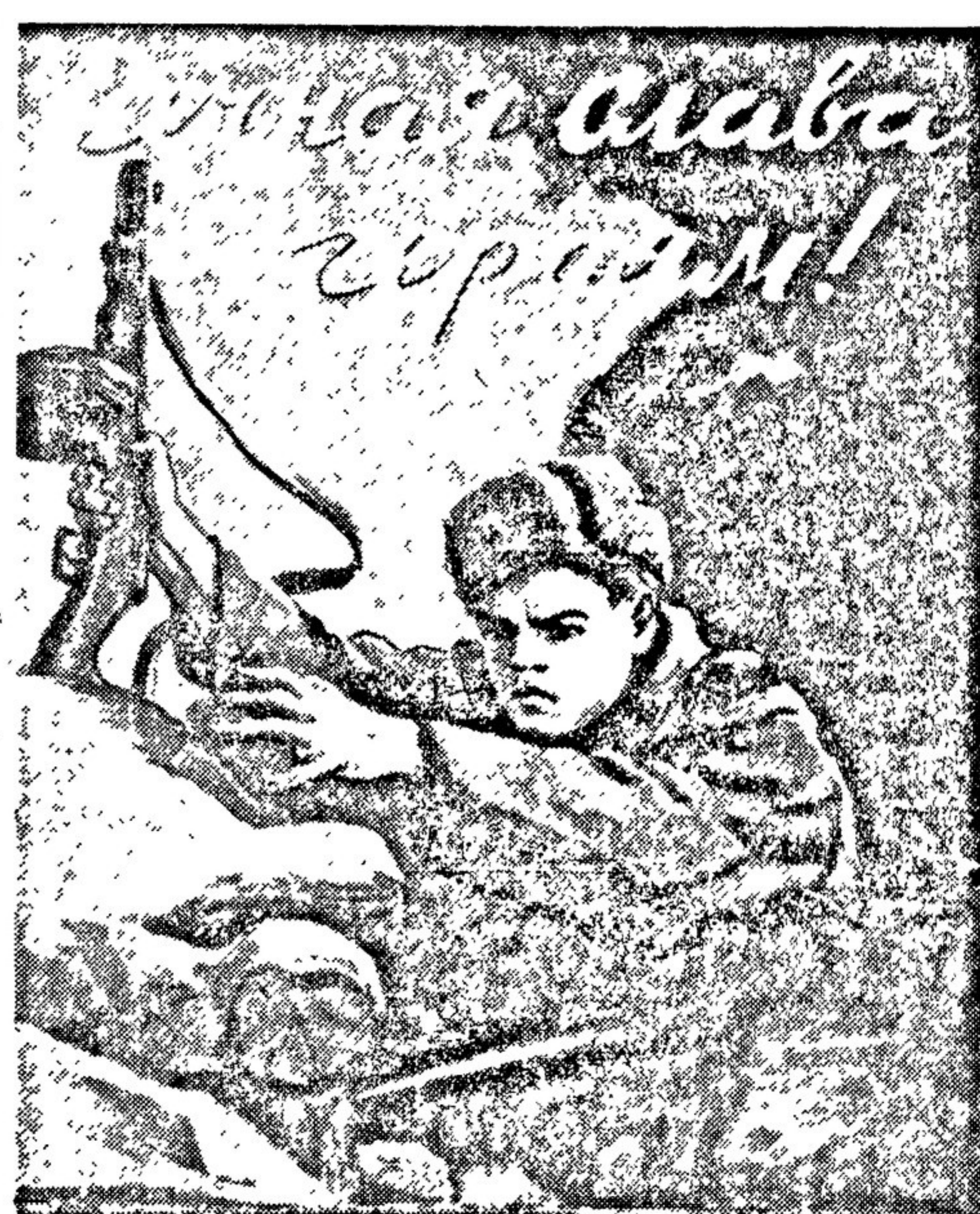
Подпись Александра Матросова. Писатель В. ИВАНОВА. Издательство «Искусство».

К 25-летию ВЛКСМ Центральная студия кинохроники выпустила киножурнал № 65, посвященный Ленинско-Сталинскому комсомолу.