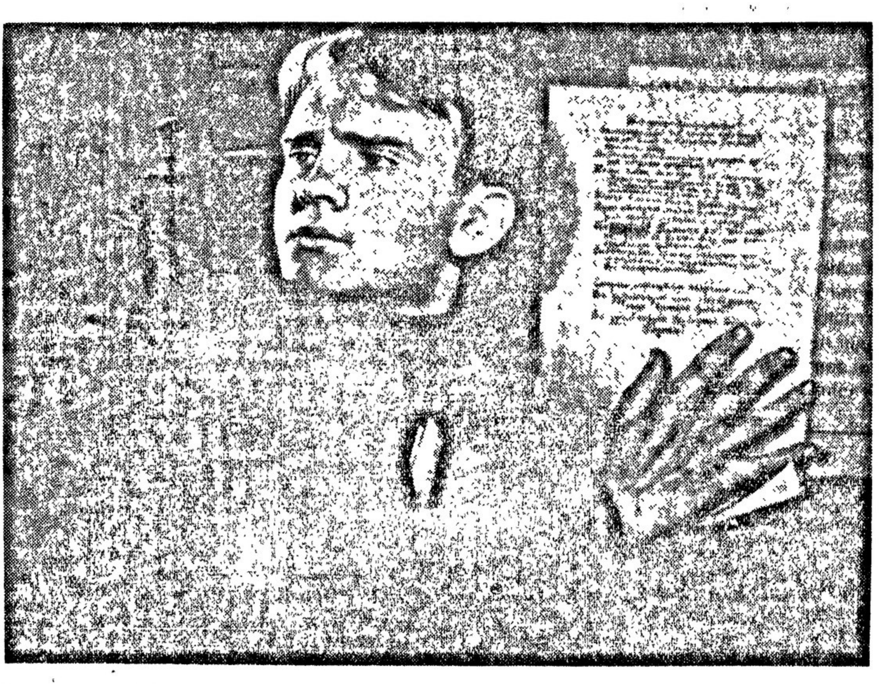
Слава «Молодой Гвардии» Краснодону! Плакат В. КОРЕЦКОГО. Издательство «Искусство».

Это все лучше и лучше начинают понимать фашистские молодчики, терпя в бегах своем изгнании, в оружейной и техникой тупости и трусости свою фабричную гандеровскую «Гитлера» пасовой исключительности, убогая при наступлении — при отступлении она приобретает обратный и весьма обидный смысл. Если же отнять у молодого немца скотское чванство убийцы-параболита, отобрать у него фотографии с изображением висящих в русских селах и городах, отобрать не спасающий от смерти амulet, подаренный ему его сам-