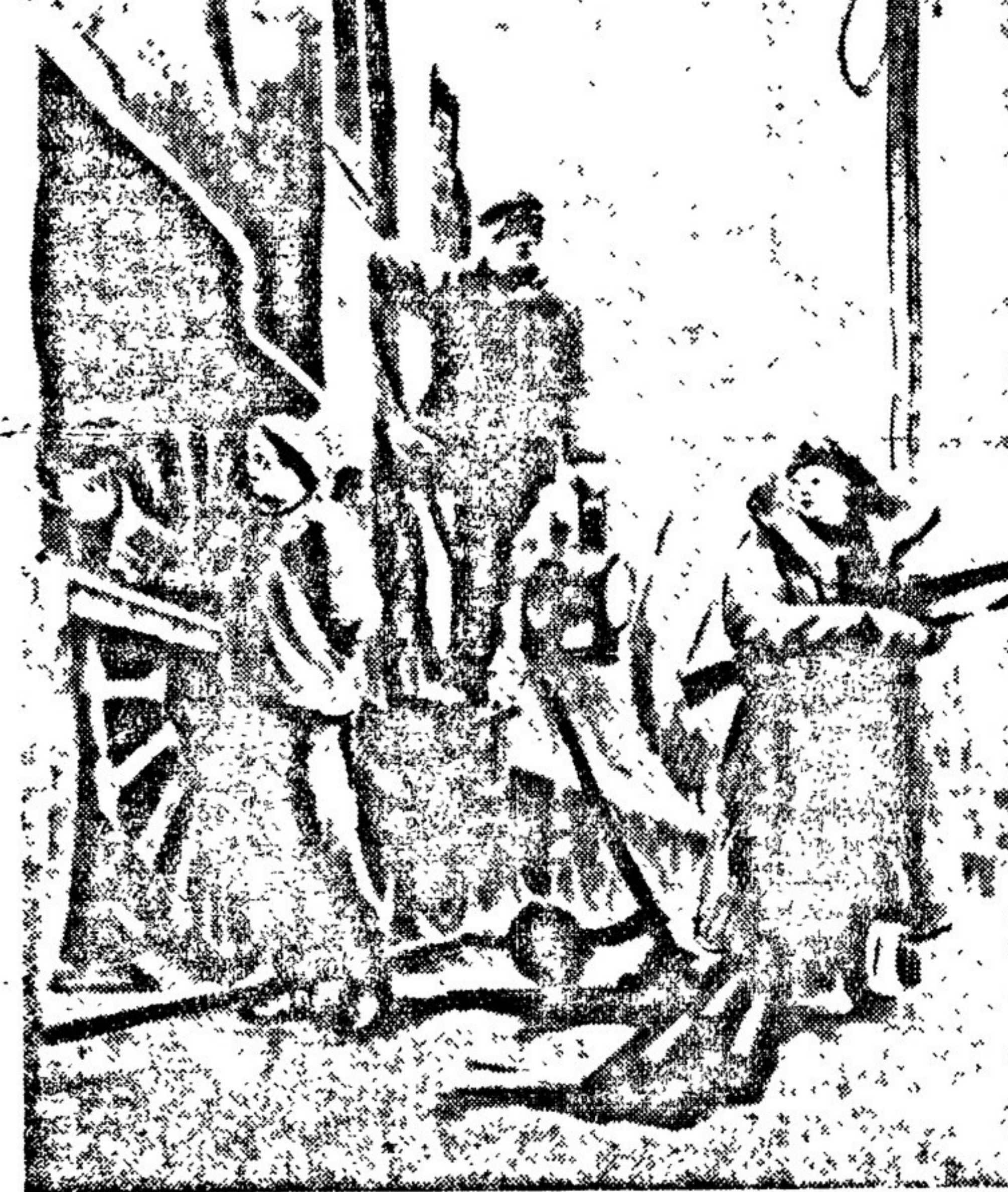
Девушки на транспорте. Рисунки утом. С. МОЧАЛОВА. Из серии «Ленинград 1948 года».

Высок уровень танцевальной са- модеятельности у ремесленничков Татарии. Они подготовили целую сюиту, состоящую из прелестных татарских народных танцев, пре- восходно поставленную Гай Таги- ровым.